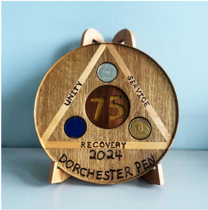
Una moneda tallada por un miembro del grupo Intramuros de Dorchester.

dice. «Ahora tenemos algunas personas muy dedicadas que vienen desde la Isla del Príncipe Eduardo a Nuevo Brunswick para ayudar con las reuniones», lo que significa que pagan un peaje de $50 para atravesar un puente y hacen un viaje de ida y vuelta de cuatro a siete horas para apoyar a los miembros reclusos.